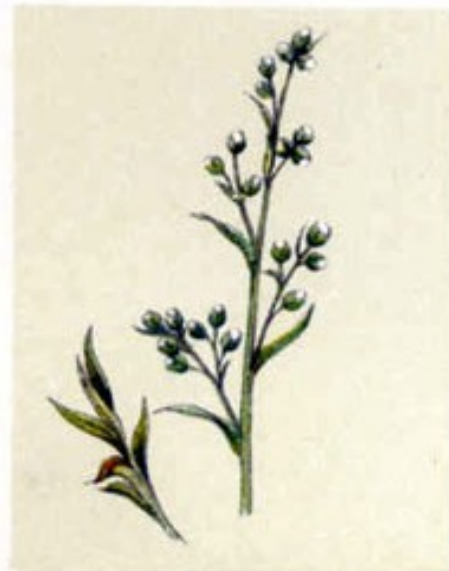
Estragon Artemisia Dracunculus L.

Curiosità: ha un aroma molto delicato tra l'anice e il sedano. Il nome latino significa "piccolo drago" e può fare riferimento sia al suo sapore pungente sia alle radici che hanno forma di serpente. Il nome francese con il quale è molto nota è "estragon".